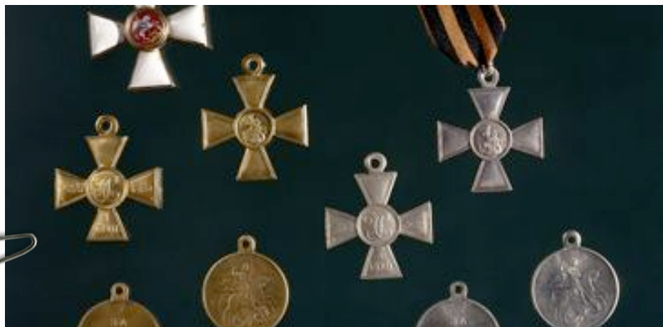
Décorations et ordres impériaux