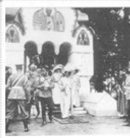
Nicolas II sortant de l'église 1906

Quelques vues pour vous mettre en appétit.