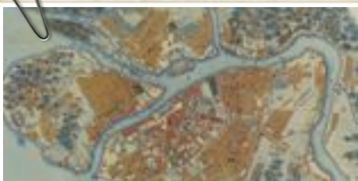
Carte de San Petersbourg en 1877